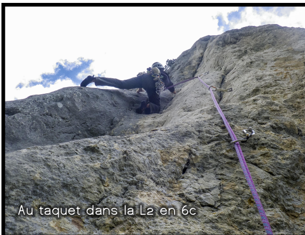
Au taquet dans la L2 en 6c

A noter un spit à droite du relais de "7", un deuxième dans la cheminée qui domine puis plus rien au dessus (rocher moyen)... Tentative d'ouverture avortée ? Voie TA ?